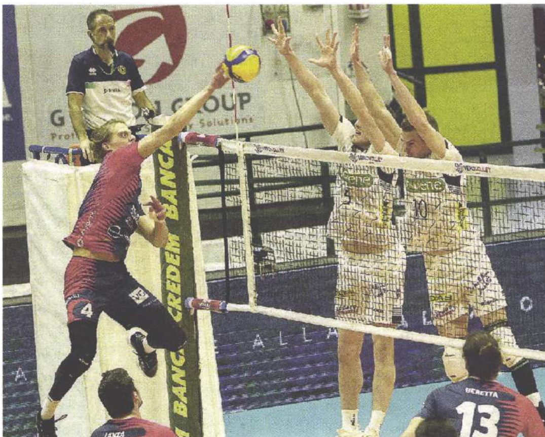
TIE BREAK FATALE I bianconeri non sono riusciti a sfruttare la loro migliore condizione fisica

NOTE. Durata set: 29', 30', 36', 21', 19'. Totale: 2 h e 15'. Monza: battute sbagliate 23, battute vincenti 8, muri 8, errori punto 33. Padova: b.s. 26, b.v. 3, m. 7, e.p. 36