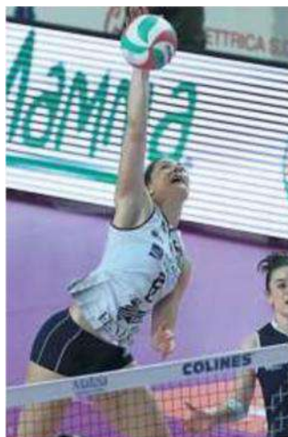
Un attacco del Chieri Fenera