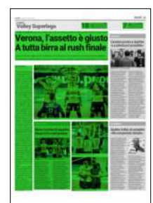
Superficie 57 %

7 Sette le partite alla fine della stagione e Verona è in corsa non solo per la salvezza ma anche per un posto ai play off