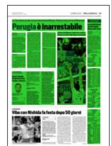
Superficie 68 %

(21-25, 19-25, 25-23, 20-25) ALLIANZ MILANO: Porro 2, Ishikawa 14, Chinenyeze 12, Patry 9, Jaeschke 14, Piano 6, Staforini (L), Romanò 4, Daldello, Mnsca 1, Pesaresi (L), Djokic. N.E. Maiocchi. All. Piazza. SIRSAFETY CONAD PERUGIA: Gian-nelli 2, Anderson 20, Mengozzi 6, Rychlicki 13, Leon Venero 23, Solé 4, Piccinelli (L), Travica, Colaci (L), Plotnytskyi 3, Ricci, Russo (L). N.E. Dardzans, Ter Horst. All. Grbic. ARBITRI: Zavater e Braico Durata set: 35', 31', 36', 32' tot. 2h14'