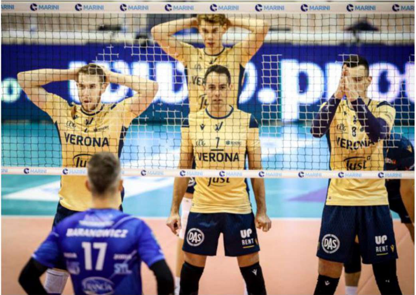
Verona Volley a Cisterna schierata durante la battuta