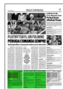
Superficie 16 %

ARTICOLO NON CEDIBILE AD ALTRI AD USO ESCLUSIVO DEL CLIENTE CHE LO RICEVE - 4