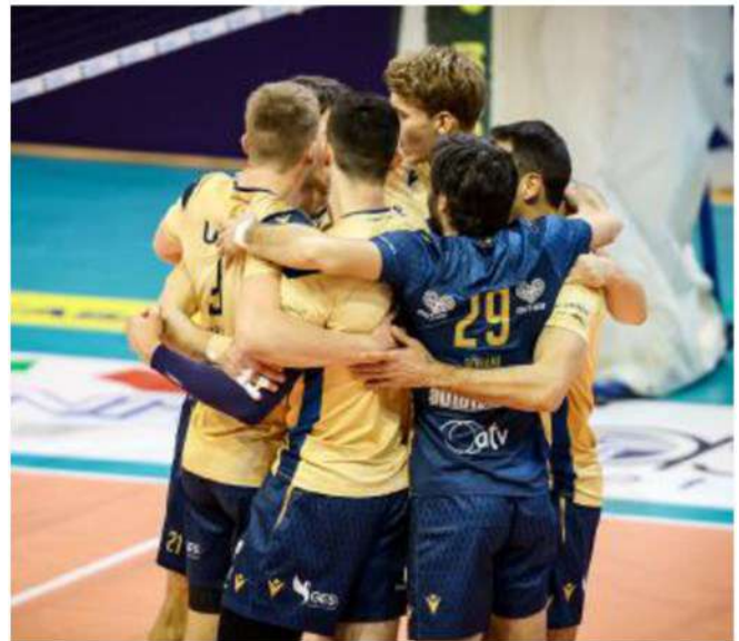
Verona si abbraccia dopo aver conquistato un punto

ARTICOLO NON CEDIBILE AD ALTRI AD USO ESCLUSIVO DEL CLIENTE CHE LO RICEVE - 4