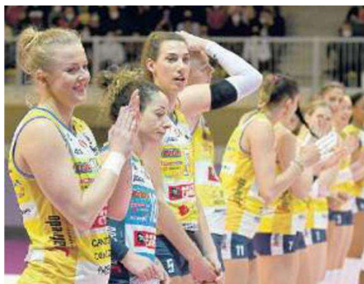
AVANTI Wolosz e compagne sono tornate a Conegliano con 2 punti

Viene coinvolta sia in battuta che in seconda linea, ma non sbaglia il servizio e fa buona copertura sotto al muro. (ms)