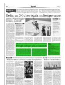
Superficie 10 %

ARTICOLO NON CEDIBILE AD ALTRI AD USO ESCLUSIVO DEL CLIENTE CHE LO RICEVE - 4