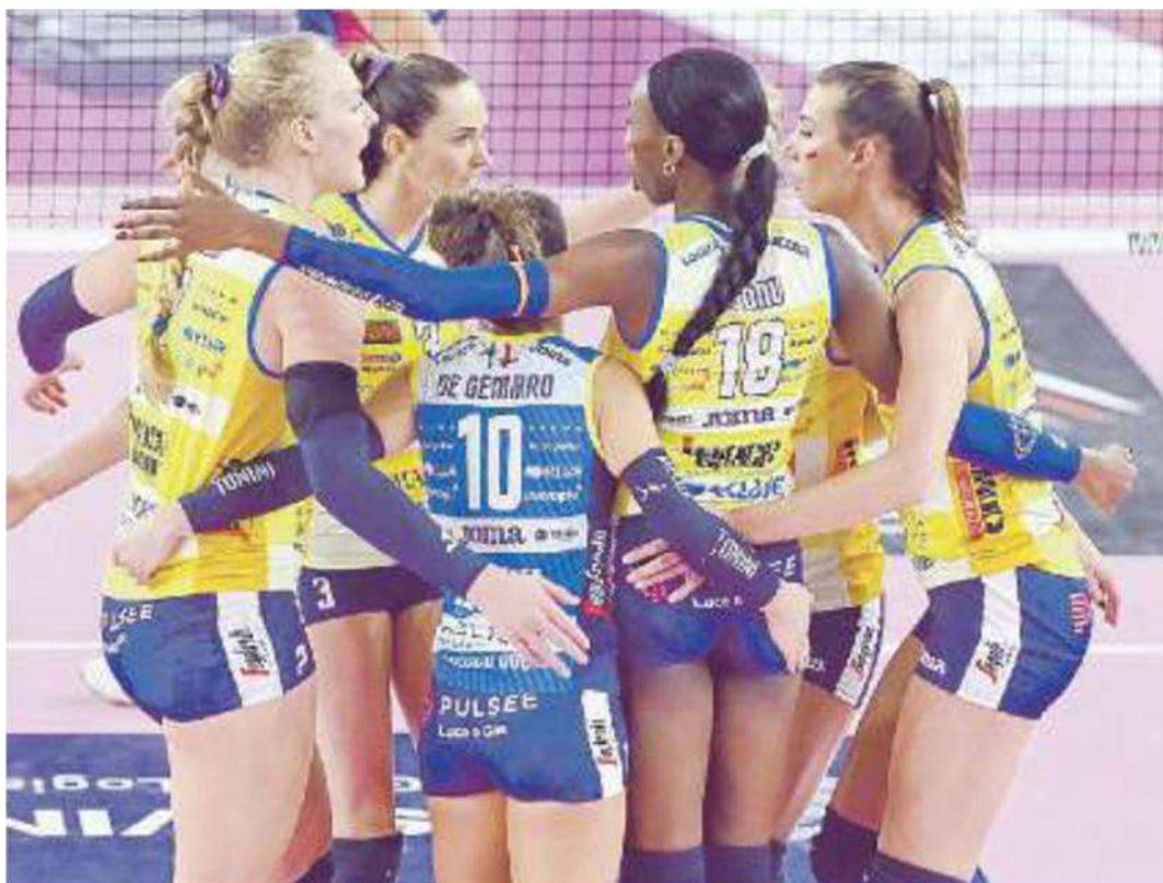
PANTERE Alla fine è arrivata la vittoria ma la vera Prosecco Doc ieri sera si è vista a sprazzi