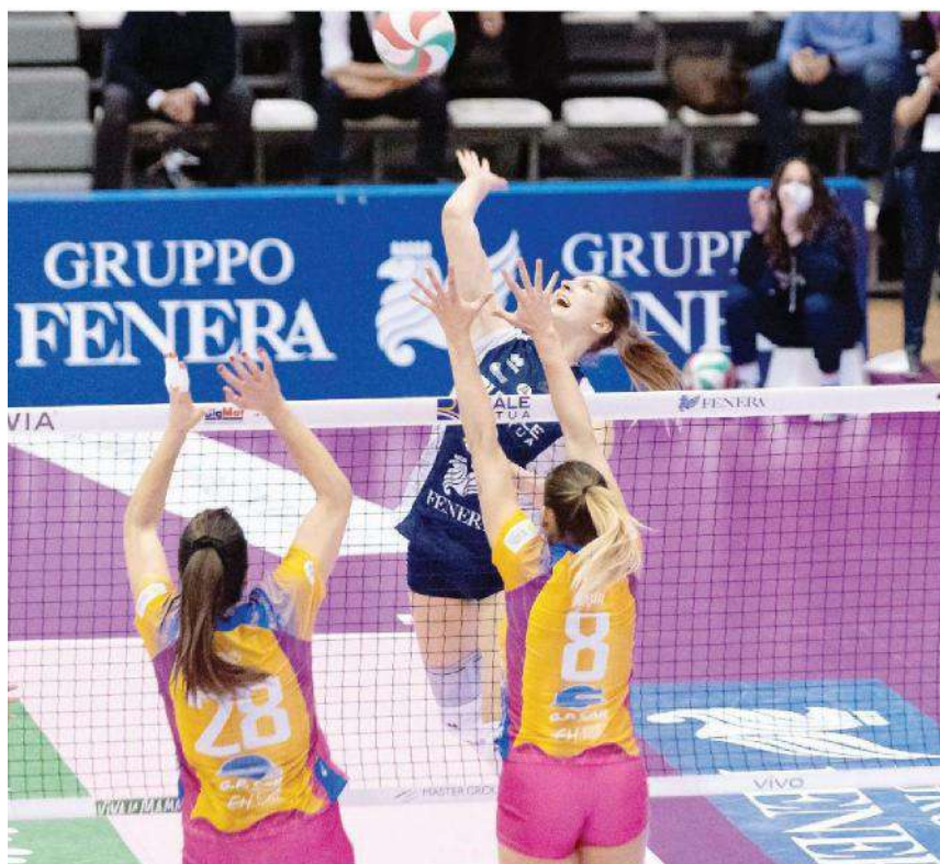
Monza ha fatto la differenza anche a muro: 10 muri-punto contro i 4 di Chieri (STURARO)

Ritaglio Stampa ad uso esclusivo del destinatario. Non riproducibile