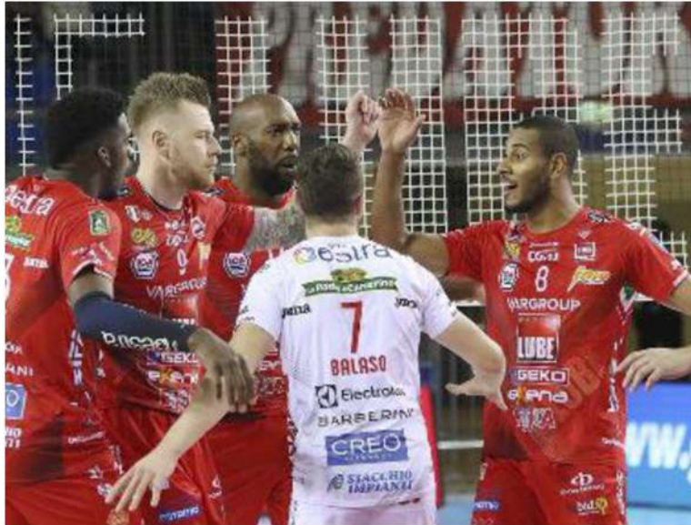
Fine dell'isolamento per i ragazzi della Lube, si torna a giocare