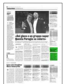
Superficie 2 %

ARTICOLO NON CEDIBILE AD ALTRI AD USO ESCLUSIVO DEL CLIENTE CHE LO RICEVE - 4