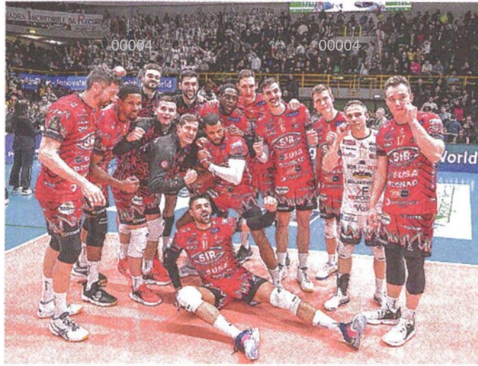
Sempre festa Perugia esulta al PalaPanini dopo aver battuto Modena BENDA

ARTICOLO NON CEDIBILE AD ALTRI AD USO ESCLUSIVO DEL CLIENTE CHE LO RICEVE - 4 - L.1976 - T.1976