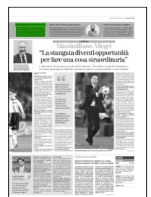
Superficie 2 %

ARTICOLO NON CEDIBILE AD ALTRI AD USO ESCLUSIVO DEL CLIENTE CHE LO RICEVE - 4 - L.1763 - T.1619