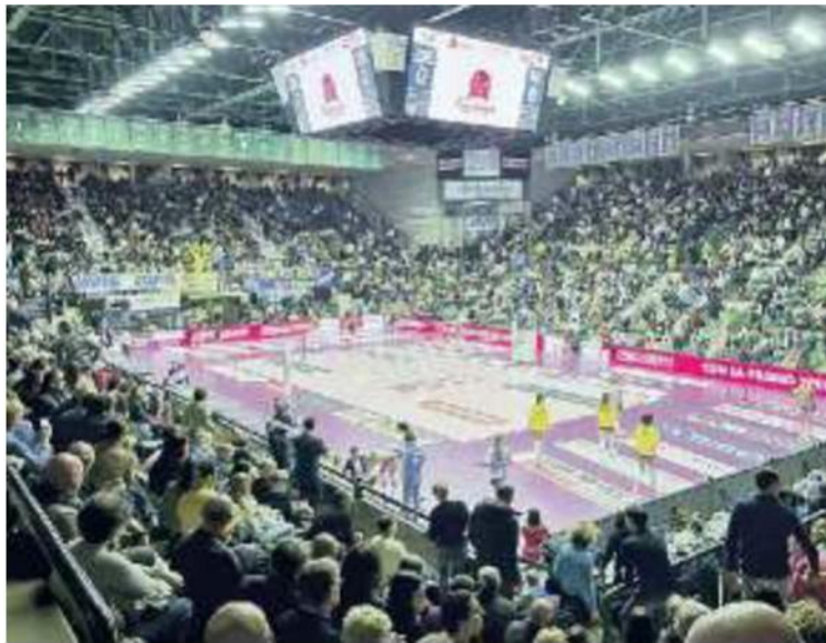
IN CASA Domani sera quarta partita di fila al Palaverde

Ritaglio Stampa ad uso esclusivo del destinatario. Non riproducibile