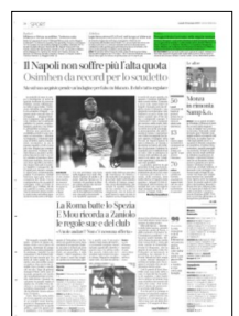
Superficie 2 %

ARTICOLO NON CEDIBILE AD ALTRI AD USO ESCLUSIVO DEL CLIENTE CHE LO RICEVE - 4 - L.1747 - T.1747