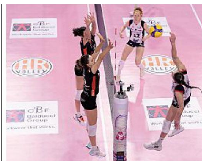
Difesa ordinata, attacchi decisi: Macerata non ha contenuto Chieri