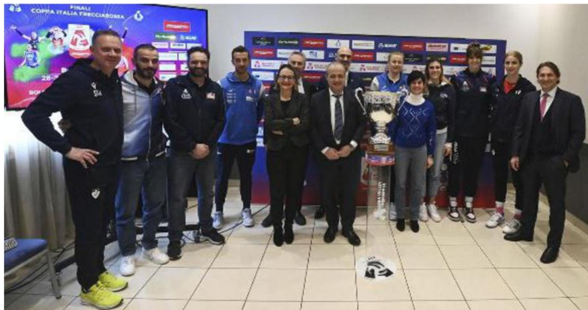
La presentazione della Final Four di Coppa Italia di pallavolo che andrà in scena oggi e domani a Casalecchio (Schicchi)