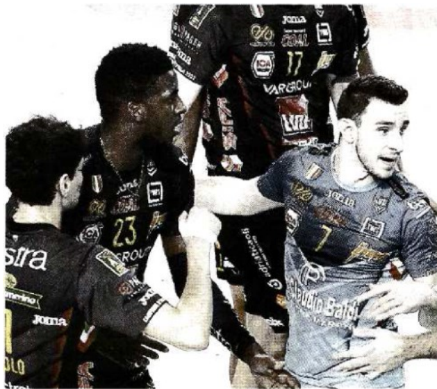
La Lube Civitanova si prepara per la trasferta a Verona

ARTICOLO NON CEDIBILE AD ALTRI AD USO ESCLUSIVO DEL CLIENTE CHE LO RICEVE - 4