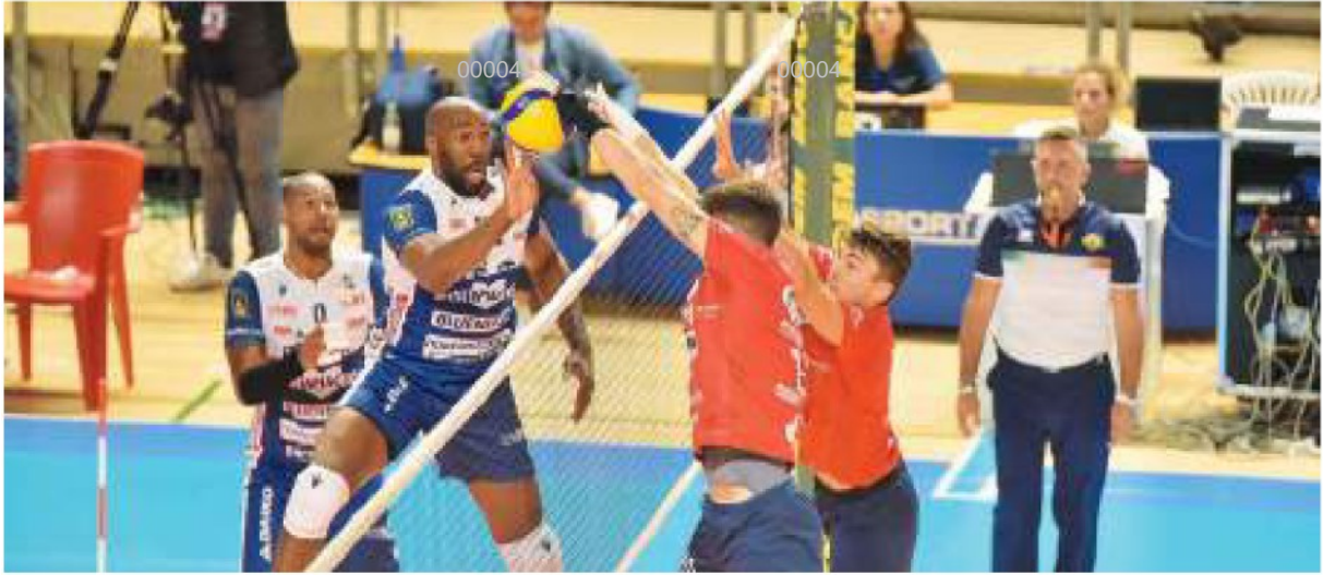
● Prisma, obiettivo vittoria

ARTICOLO NON CEDIBILE AD ALTRI AD USO ESCLUSIVO DEL CLIENTE CHE LO RICEVE - 4