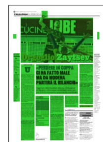
Superficie 84 %

«Mi aspetto una crescita. Che continuiamo a lavorare, visto che la società ha varato questo ringiovanimento per fare ripartire un ciclo vincente. E all'inizio di un nuovo percorso ci sono