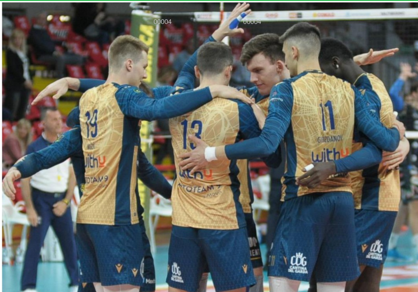
WithU Verona al PalaBarton contro la Sir Safety conduceva 2-1 e poi è stata sconfitta al tie break

ARTICOLO NON CEDIBILE AD ALTRI AD USO ESCLUSIVO DEL CLIENTE CHE LO RICEVE - 4