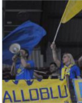
Tifosi della Maraia a Perugia