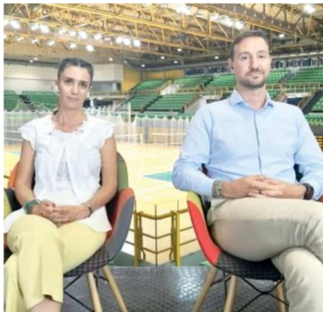
Chi sarà il nuovo tecnico di Modena Volley?

Venerdì scorso Modena Volley ha comunicato a sorpresa che le strade con il tecnico si separeranno a fine stagione