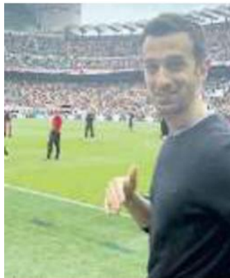
TIFO Santarelli ieri a San Siro

Ritaglio Stampa ad uso esclusivo del destinatario. Non riproducibile