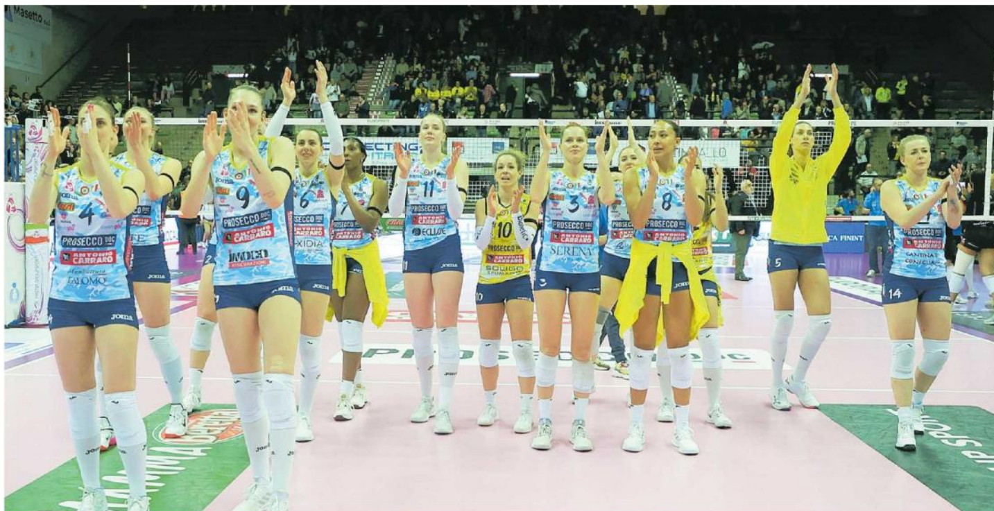
Le Pantere della Prosecco Doc Imoco in passerella al Palaverde: smaltita la delusione Champions, sono pronte ad inseguire il quinto tricolore di fila FOTO FILM

Ritaglio Stampa ad uso esclusivo del destinatario. Non riproducibile