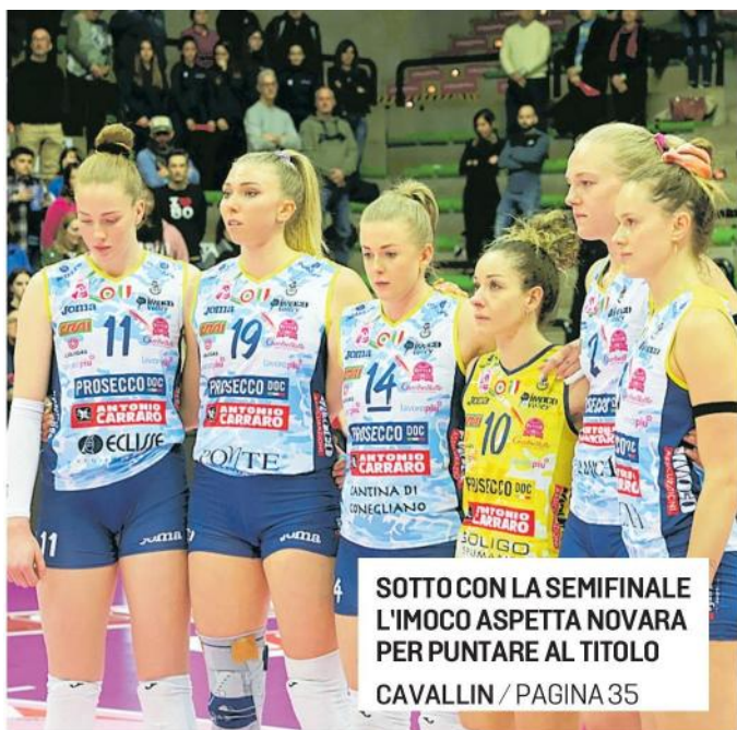
SOTTO CON LA SEMIFINALE L'IMOCO ASPETTA NOVARA PER PUNTARE AL TITOLO CAVALLIN / PAGINA 35

VOLLEY: Semifinale scudetto, mercoledì G-1 Lavarini ha vinto un solo match con l'Imoco