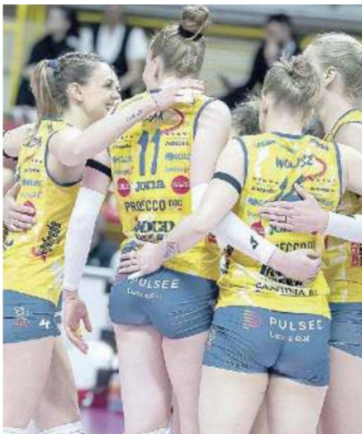
GRAN FINALE Le pantere puntano al quinto tricolore consecutivo

Palaverde ore 20.45 diretta Rai Sport HD, Sky Sport Arena e Vbtv