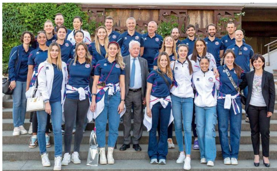
Le giocatrici della Savino Del Bene Volley in piazza della Resistenza a Scandicci