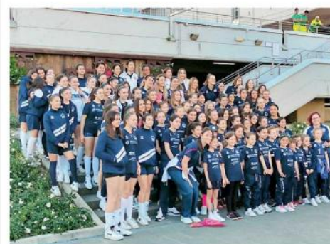
Le atlete delle squadre giovanili della Savino Del Bene Volley