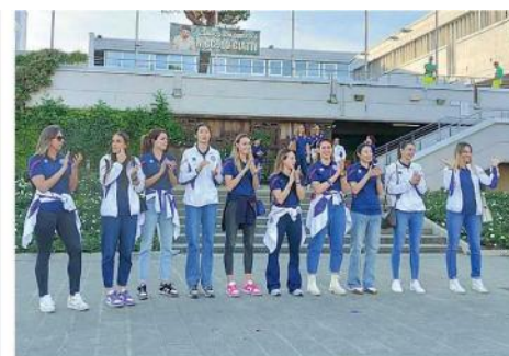
L'applauso delle giocatrici alla piazza