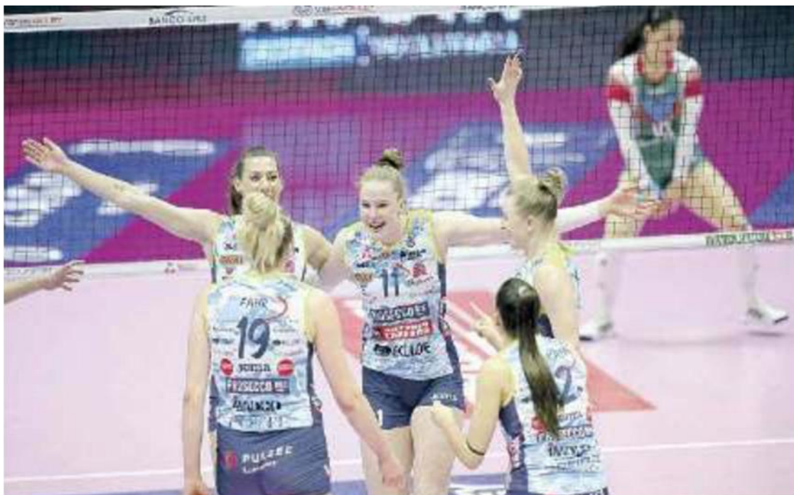
PROSECCO DOC Le pantere da ottobre avranno avversarie ancor più temibili del recente passato