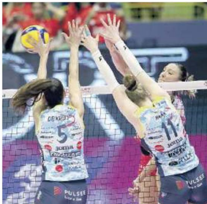
TRICOLORI Le pantere Prosecco Doc Imoco, sei scudetti in bacheca