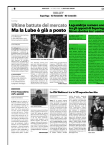
Superficie 16 %

ARTICOLO NON CEDIBILE AD ALTRI AD USO ESCLUSIVO DEL CLIENTE CHE LO RICEVE - 4