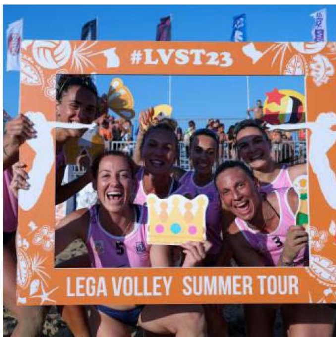
Le ragazze della Vbc esultano dopo la vittoria

Nell'altro raggruppamento la favoritissima Vero Volley Milano, che abbraccerà in questa tappa anche Vittoria Prandi e Sofia Candi, se la vedrà all'esordio contro la Millennium Brescia mentre la terza formazione del girone B sarà la Motorola Busto Arsizio. La mattina di domani vedrà invece in campo le deluse del sabato per il quinto posto oltre alle due semifinali che delinearanno la finalissima in programma nel pomeriggio di domani. Casalmaggiore, dopo l'immensa soddisfazione della prima tappa, non vuole fermarsi e punta a giocare un altro titolo della sabbia.