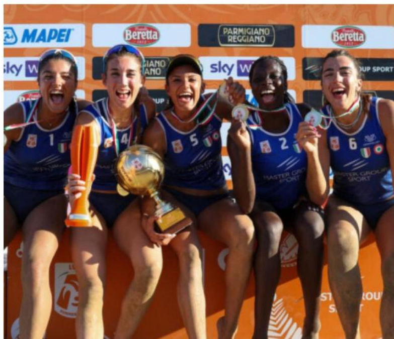
Le neo campionesse d'Italia del Vero Volley Milano