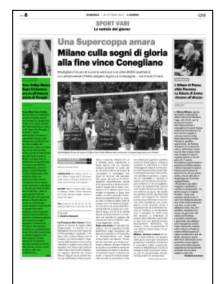
Superficie 12 %