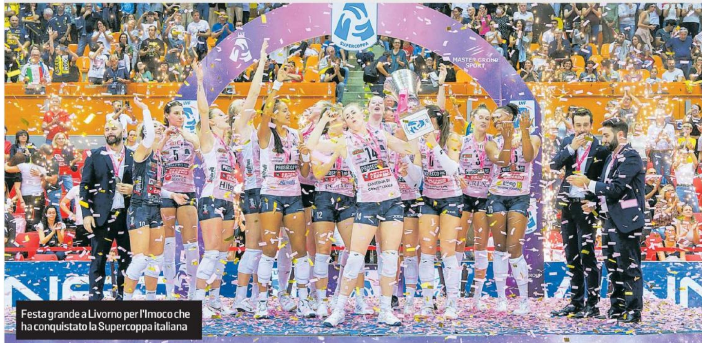
Festa grande a Livorno per l'Imoco che ha conquistato la Supercoppa italiana