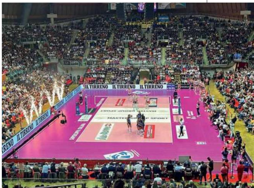
L'impressionante colpo d'occhio del Modigliani Forum: 8.300 spettatori