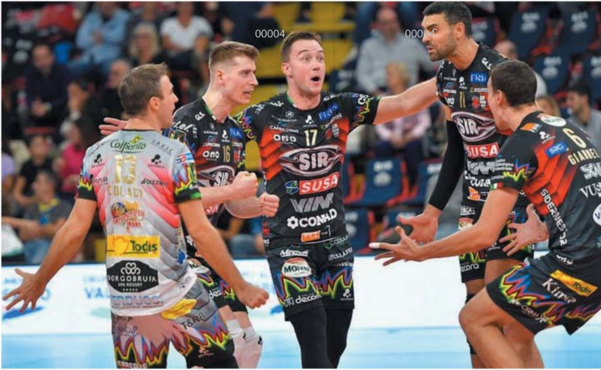
Tutto facile Per la Sir Susa Vim nell'esordio con Catania