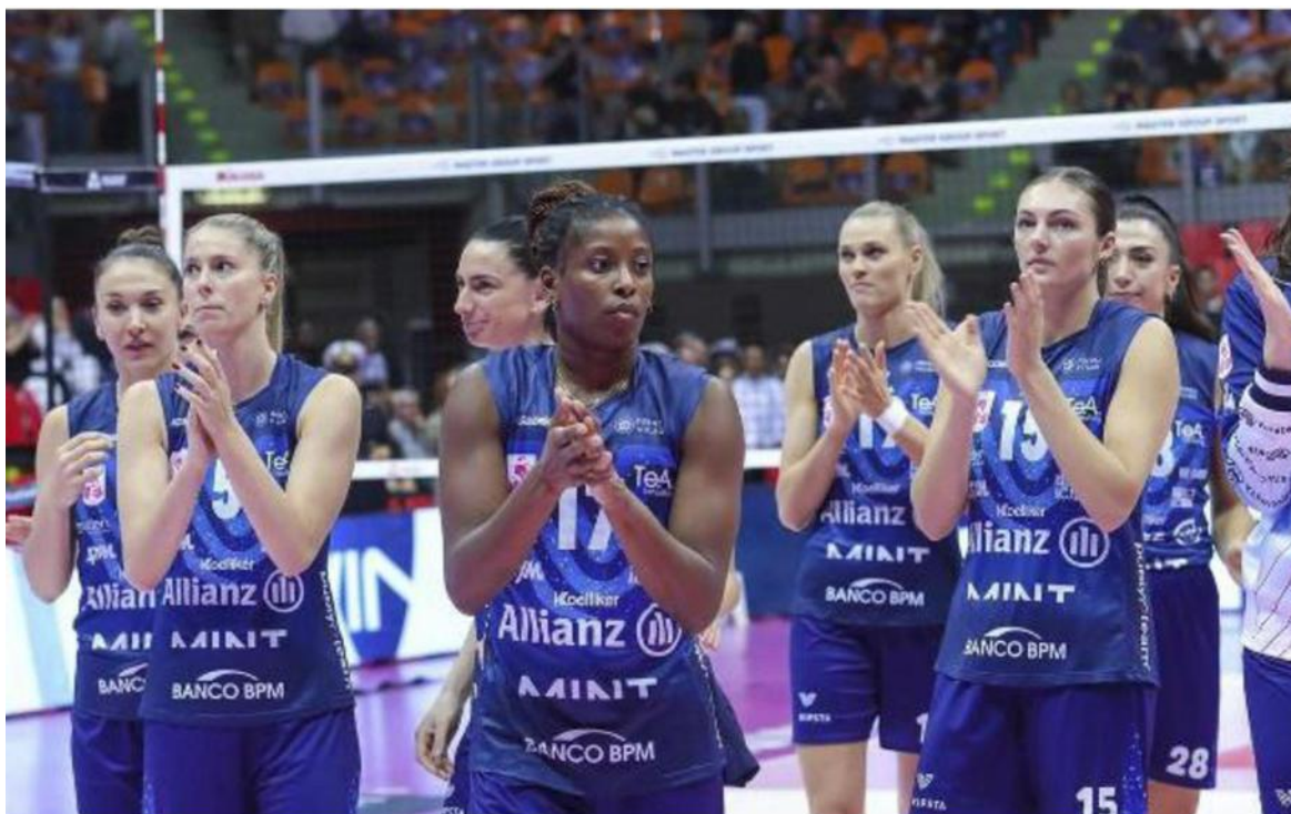
Dal Modigliani Forum di Livorno l'Allianz Vero Volley Milano esce a testa alta. La Supercoppa però va in Veneto

Ritaglio Stampa ad uso esclusivo del destinatario. Non riproducibile