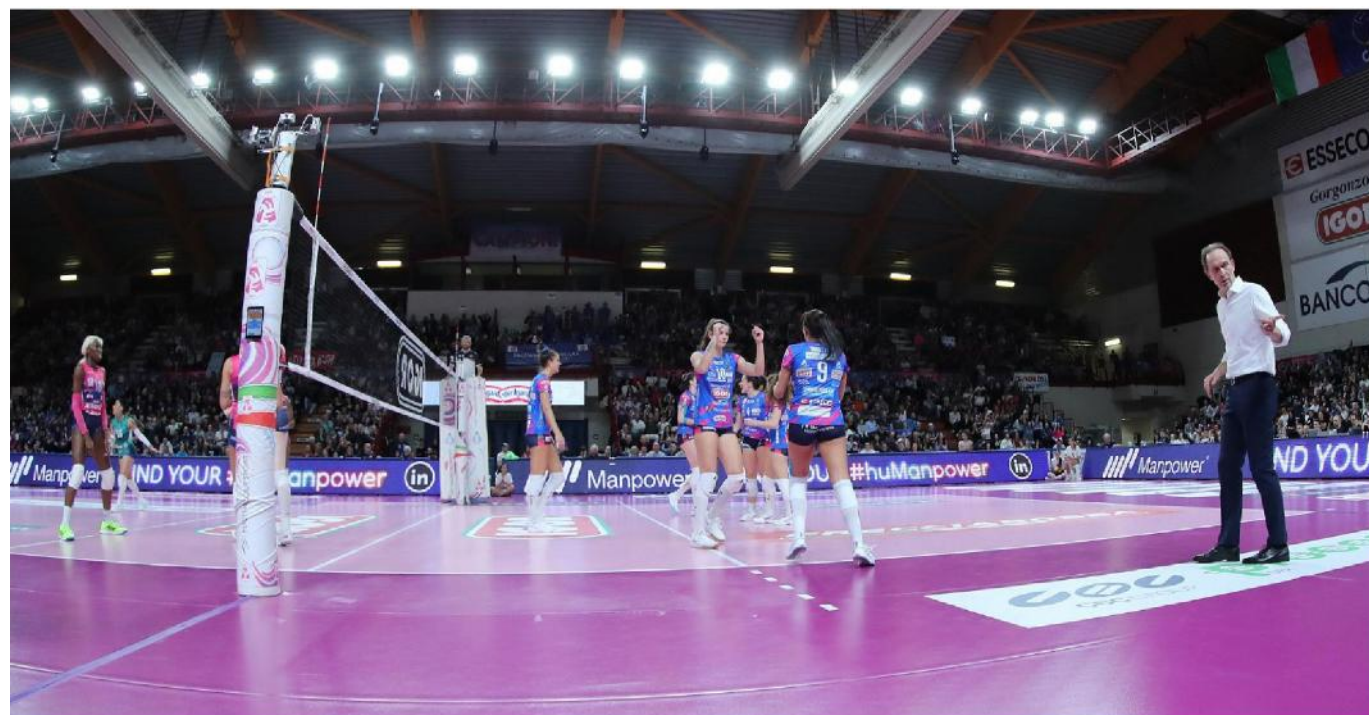
TUTTO ESAURITO Il colpo d'occhio del PalaIgor ieri pomeriggio durante il match tra Novara e Milano