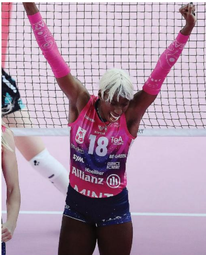
Paola Egonu, 24 anni, ha vinto una Champions con Novara LVF

PROSSIMO TURNO 8ª giornata d'andata 18/11 ore 18 Chieri-Trentino; ore 20.30 Casalmaggiore-Roma; 19/11 ore 17 Milano-Pinerolo; Vallefoglia-Novara; Firenze-Busto Arsizio; Cuneo-Scandicci; ore 19.30 Bergamo-Conegliano