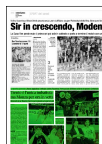
Superficie 33 %