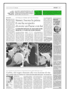
Superficie 3 %

ARTICOLO NON CEDIBILE AD ALTRI AD USO ESCLUSIVO DEL CLIENTE CHE LO RICEVE - 4 - L.1747 - T.1747