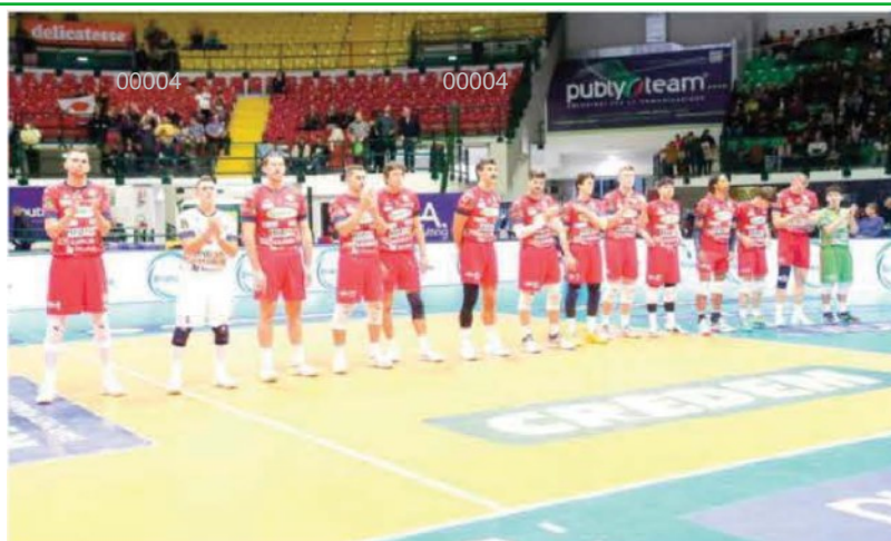
La Prisma Taranto scesa in campo contro Monza