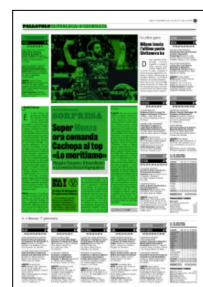
Superficie 43 %

GIOIELLA PRISMA TARANTO Alletti 1, Russell 3, Lanza 4,