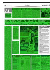
Superficie 70 %

spiegato al termine della gara l'allenatore dell'Itas Trentino Fabio Soli -. Questa è stata la più bella vittoria di questo gruppo da quando lo allenò, perché magari il gioco non sarà stato sempre spettacolare ma i ragazzi hanno saputo mettere in campo grande abnegazione, concretezza e spirito di sacrificio. Siamo riusciti a stare dentro una partita difficile, accettando la lotta palla su palla e dimostrando di saper stare sempre e comunque in campo senza perdere di vista l'obiettivo. È un ottimo punto di partenza in vista delle tante partite che ci attendono nel prossimo periodo».