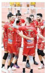
La festa della Lube GALBIATI

Vittoria mai messa in discussione Petrella: «Mercato? C'è la società» Blengini: «Punti su campo difficile»