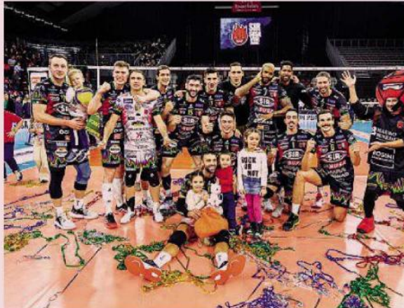
Un'altra festa. La Sir Perugia al PalaBarton: i giocatori in campo con i figli dopo la vittoria contro Piacenza

ARBITRI Giardini e Puecher NOTE Spettatori 3609. Durata set: 29', 26', 26', 33', 29'. Totale 145'. Sir Susa Vim Perugia: battute sbagliate 16, battute vincenti 8, muri 12, errori 26; Qas Sales Piacenza: b.s. 20, v. 6, m. 14, e. 3. Trofeo Gazzetta: 6 Leal, 5 Solè, 4 Herrera, 3 Semeniuk, 2 Simon, 1 Flavio. (a.n.m.)