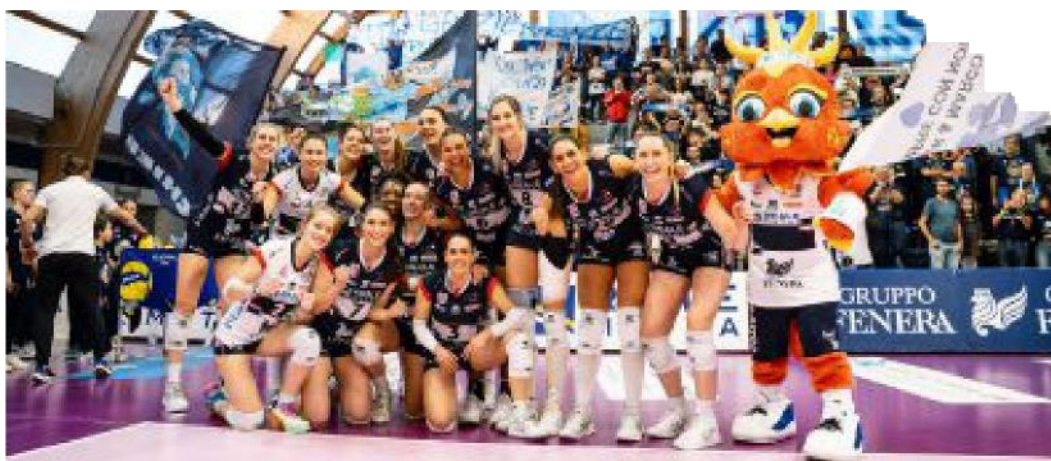
Le ragazze di Chieri al PalaFenera

■ Non c'è veramente il tempo per tirare il fiato. A tre giorni dalla conclusione della regular season, questa sera in serie A1 femminile scatteranno i playoff e saranno in gara entrambe le squadre torinesi. La Reale Mutua Fenera Chieri '76, che una settimana fa ha conquistato la Cev Volleyball Cup, si è congedata dal PalaFenera per questa stagione, battendo per 3-0 la Trasportipesanti Casalmaggiore e conquistando il quinto posto. Alle ore 20,30, in gara-1 dei quarti di finale, sarà ospite della Igor Gorgonzola Novara, che è terminata quarta. «Sarà