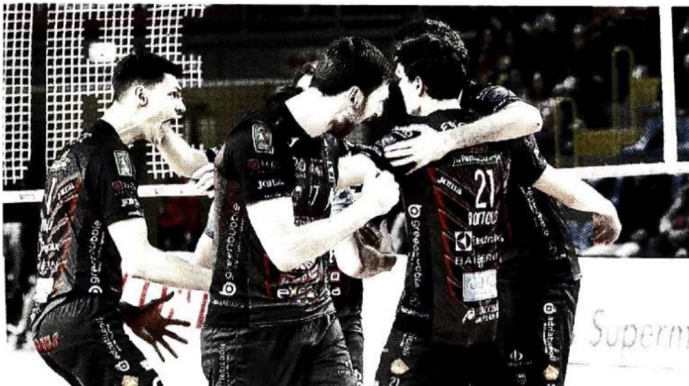
La Lube Civitanova questa sera affronta in casa la decisiva gara 5 dei quarti di finale scudetto