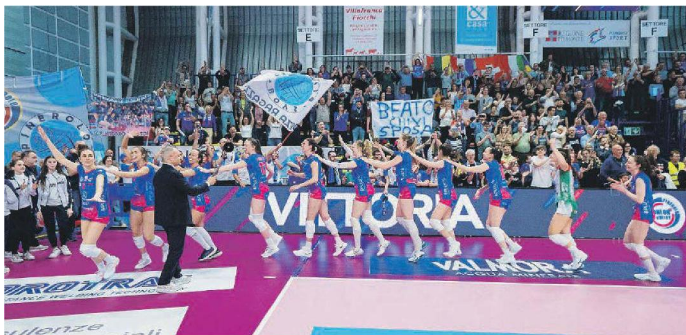
Il trenino delle giocatrici pinerolesi al termine della gara vinta con un netto e meritato 3-0.