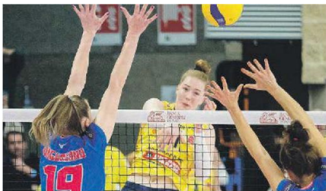
Una fase di Pinerolo-Conegliano.

■ Conclusa l'ultima giornata di Regular Season si è finalmente definita la classifica e con essa retrocessioni, salvezze e play-off. Insieme a Trento, retrocessa ormai da qualche settimana si è aggiunta, un po' a sorpresa Cuneo, dopo sei stagioni in A1. La squadra piemontese è uscita sconfitta dal match esterno con Firenze mentre Bergamo è riuscita a conquistare il punto della salvezza con Scandicci (2-3). Il calendario agevolava sicuramente le biancorosse che dovevano affrontare una Firenze ormai salva ma senza possibilità di accedere ai play-off mentre Bergamo aveva sul suo cam-