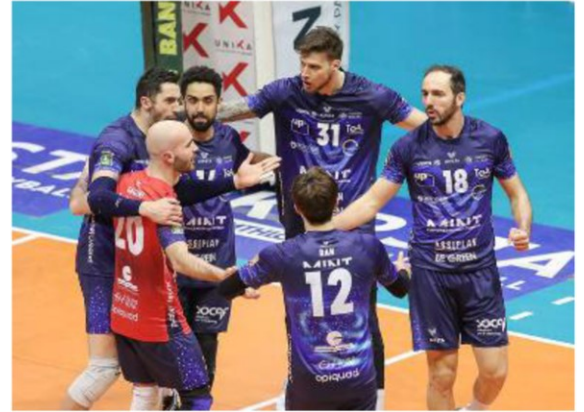
Monza nelle Marche per la sfida che vale un posto in semifinale scudetto