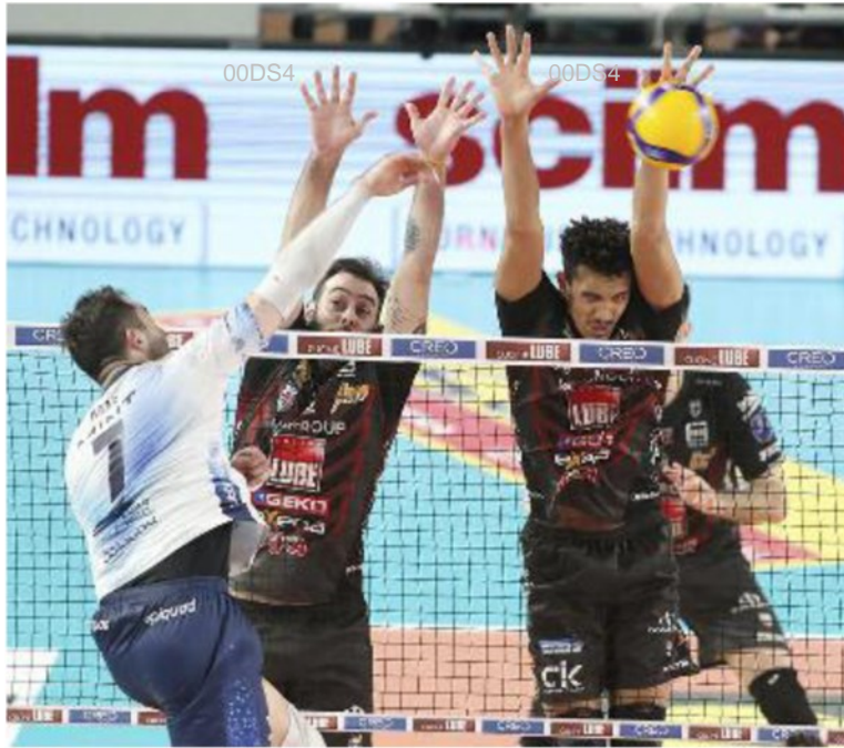
Un muro di De Cecco e Chinenzeze

ARTICOLO NON CEDIBILE AD ALTRI AD USO ESCLUSIVO DEL CLIENTE CHE LO RICEVE - DS4 - S.33014