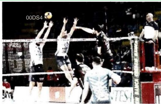
Due fasi della Gara 1 dei quarti di finale scudetto giocata a Civitanova tra la Lube e Monza che ha strappato la vittoria

ARTICOLO NON CEDIBILE AD ALTRI AD USO ESCLUSIVO DEL CLIENTE CHE LO RICEVE - DS4 - S.33014