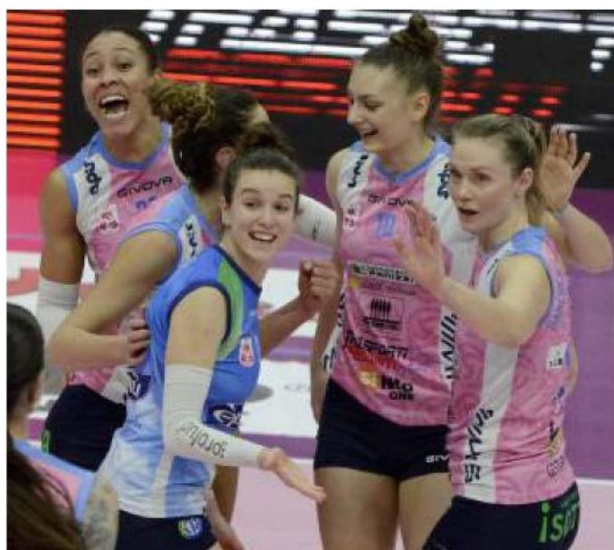
Un'esultanza delle giocatrici rosa