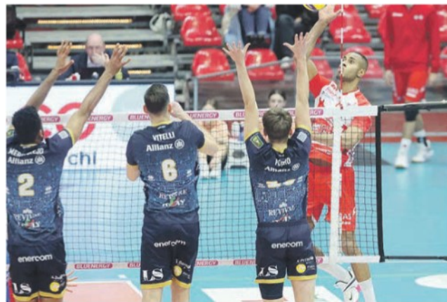
Leal cerca di superare il muro alzato da Allianz

● Ieri sera Perugia non ha fatto sconti imponendosi per 3-1 contro l'ostica Verona. E' il primo mattone per il passaggio del turno al termine di una gara nervosa e ricca di insidie.